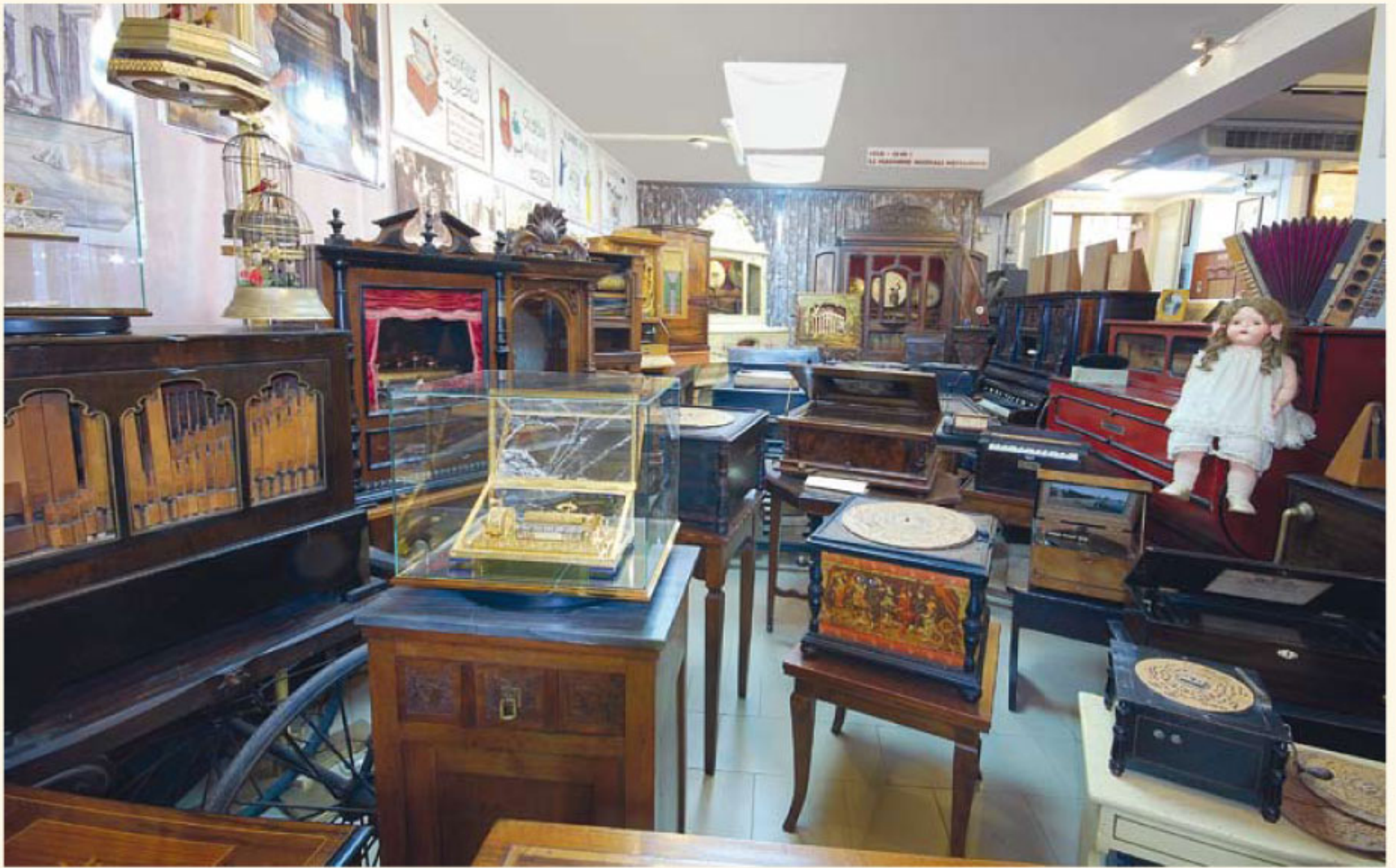
Organi, organetti, carillon, pianole, orchestrion... la fantastica musica meccanica del '700-'800! (particolare)