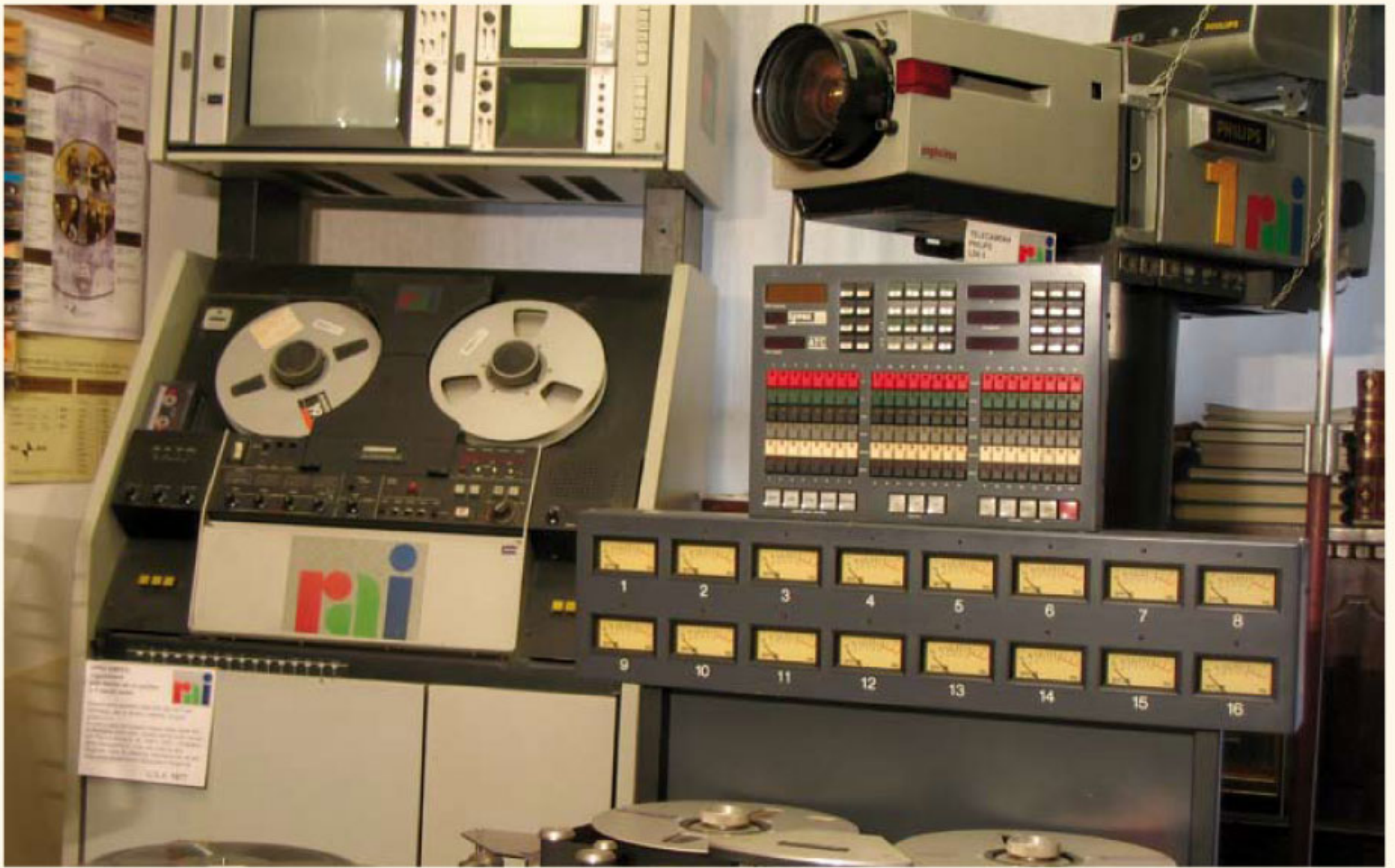
Audio video in onda (particolare)