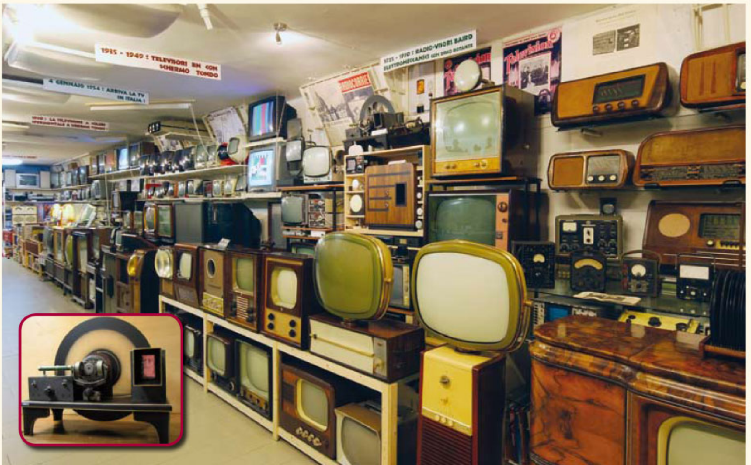
Disco di Nipkow, radiovisore di Baird, TV bianco e nero, televisione a colori, TV digitale... 100 anni di trasmissioni! (particolare)