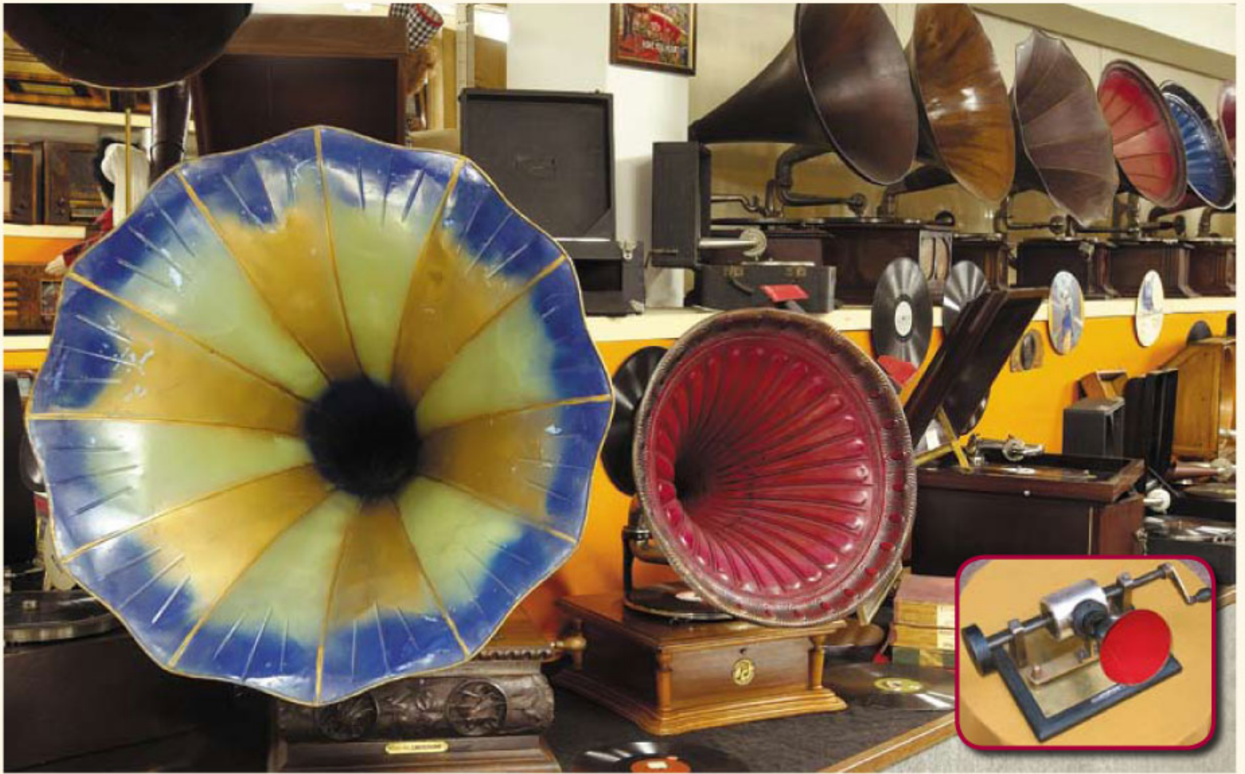
Edison...Pathè ... cilindri di cera ... dischi ... parata di trombe centenarie (particolare)