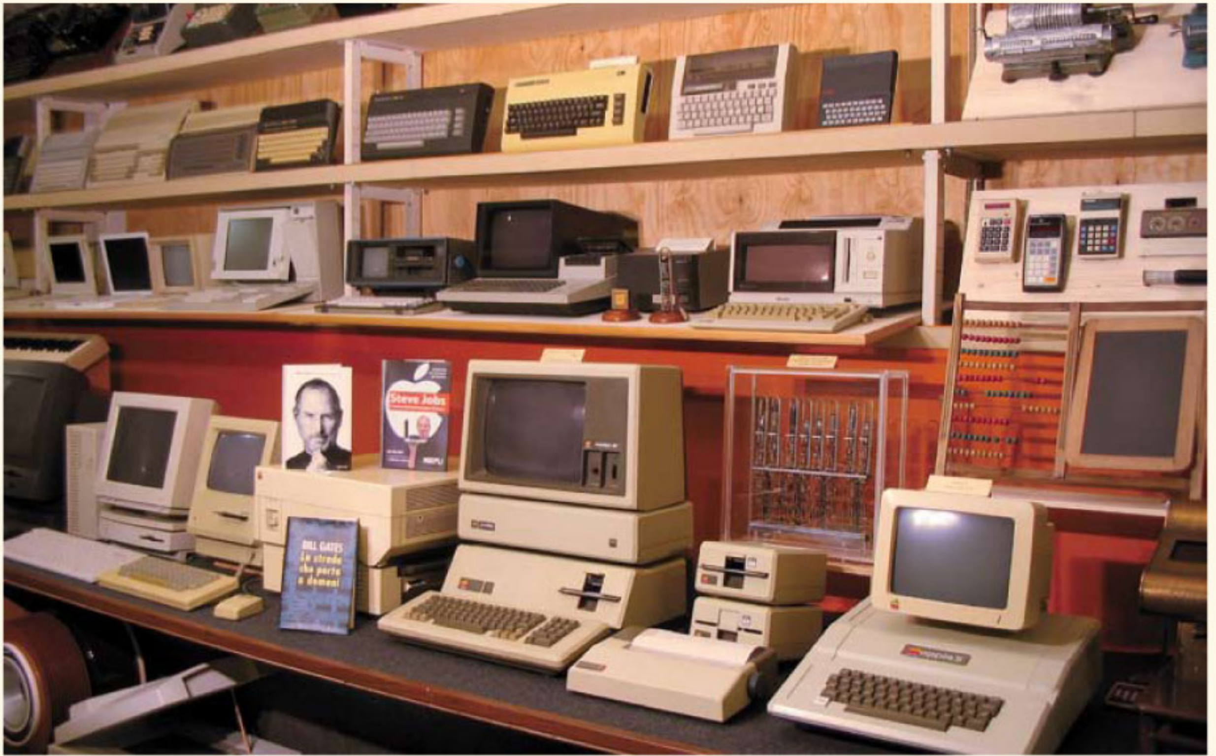
Pallottoliere, regolo, calcolatrici meccaniche, calcolatori a valvole, Commodore 64, Apple, Steve Jobs, Bill Gates ... la storia del computer! (particolare)