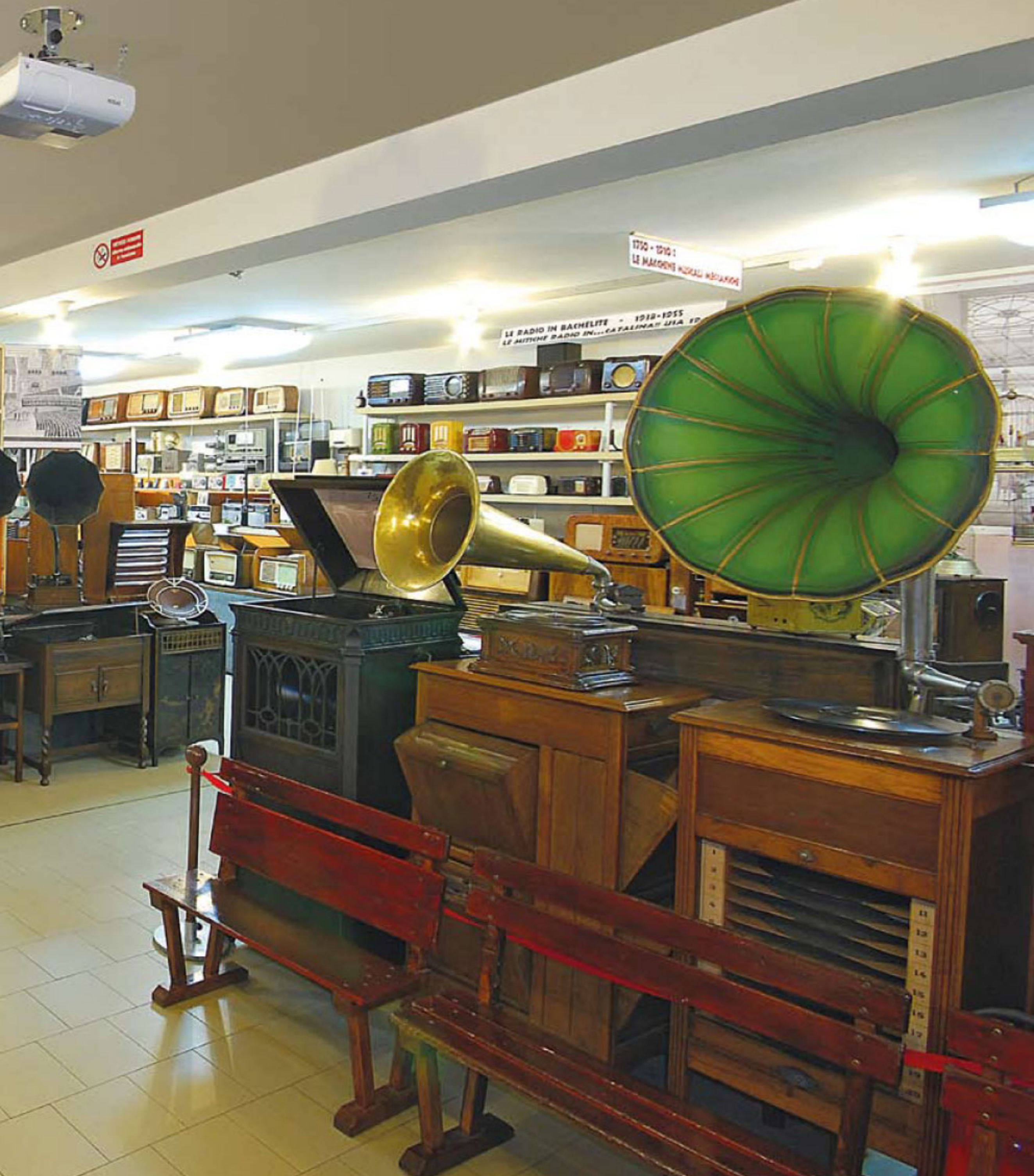
Salone d'ingresso del Museo G. Pelagalli · Bologna · Italy