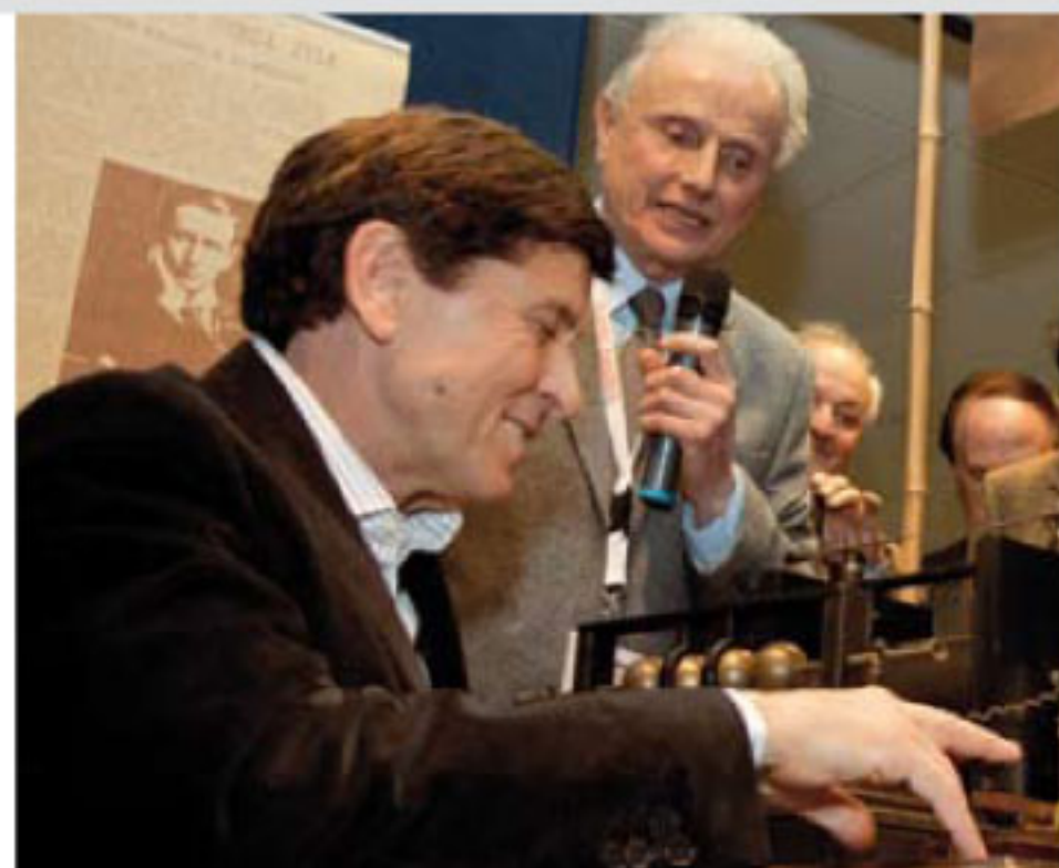
Foto a destra: Gianni Morandi si cimenta a trasmettere i segnali radiotelegrafici marconiani col "tavolino trasmettitore" lì esposto.

Foto a Sinistra: Gianni Morandi inaugura la Mostra allestita da Pelagalli al Palafiori di Sanremo... 400 metri quadrati... sei isole museali allestite... 30.000 visitatori nella settimana del 61mo Festival.