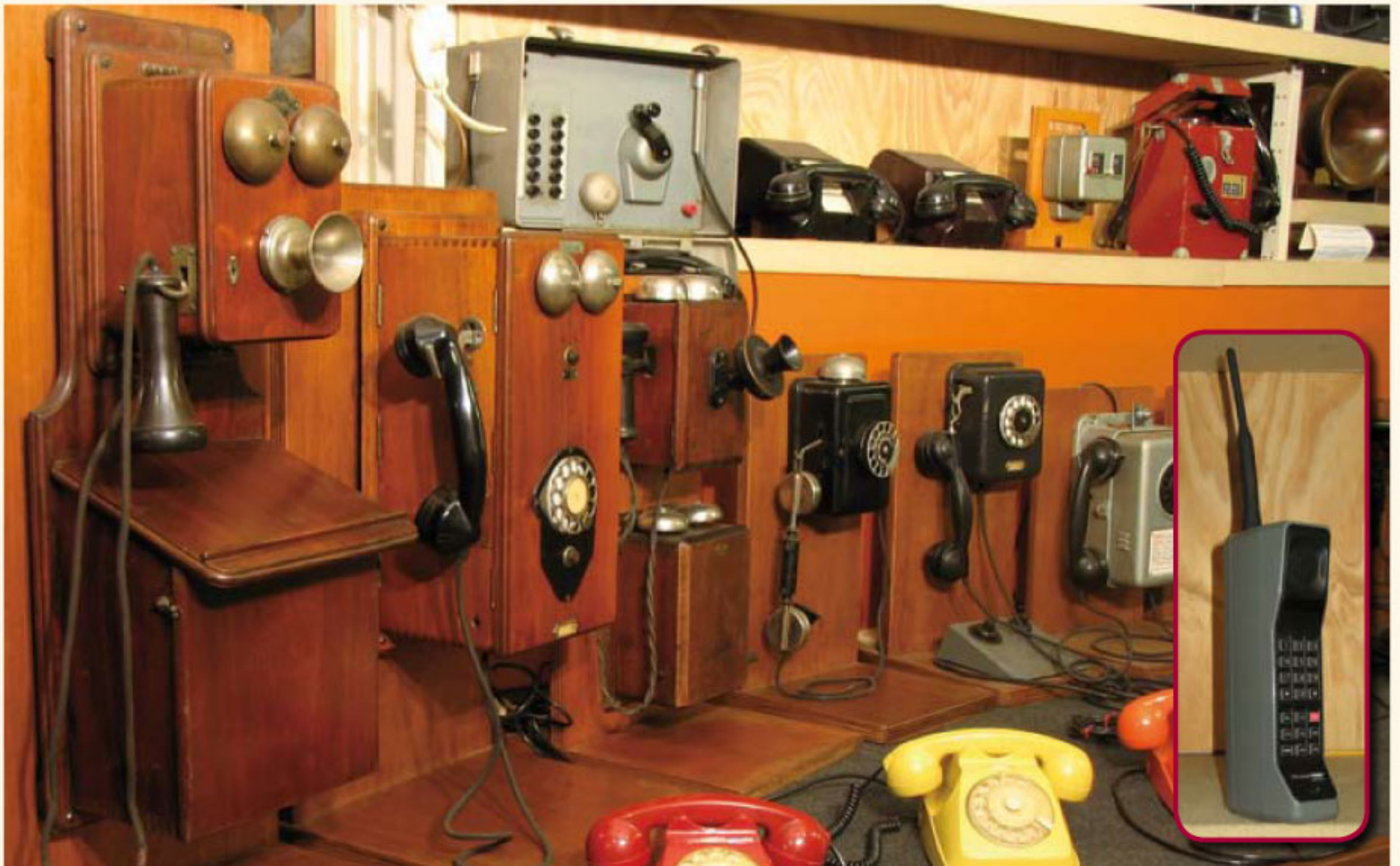
Microfono di Hughes ... capsule del Meucci ... il telefono ... il cellulare! (particolare)