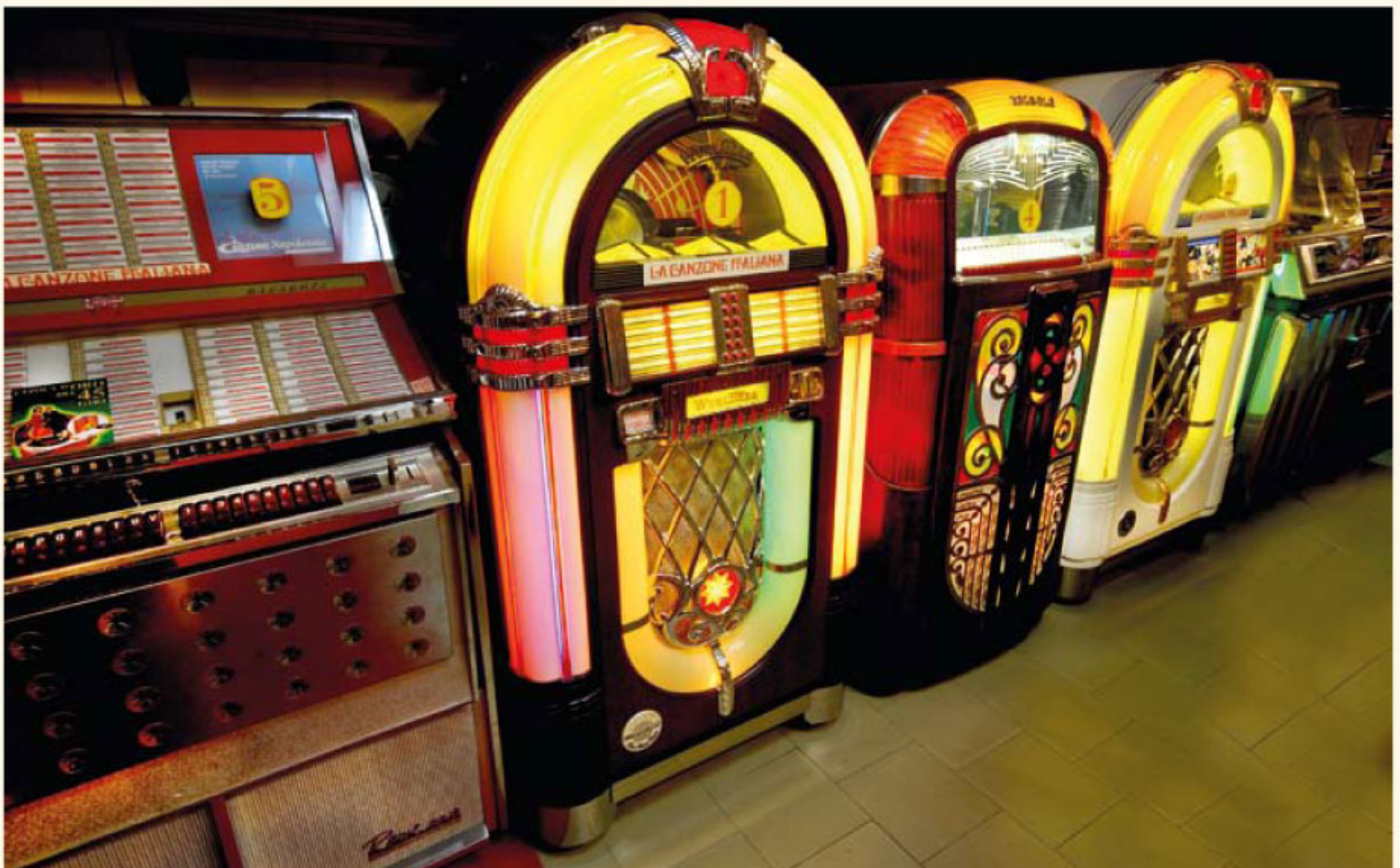
Musica... canzoni ... juke boxes ... 11 mila titoli pronti per essere gettonati e ascoltati! (particolare)

UN MUSEO...TUTTO DA VEDERE... TUTTO DA SCOPRIRE... TUTTO DA ASCOLTARE... UN MUSEO VIVO E PULSANTE!