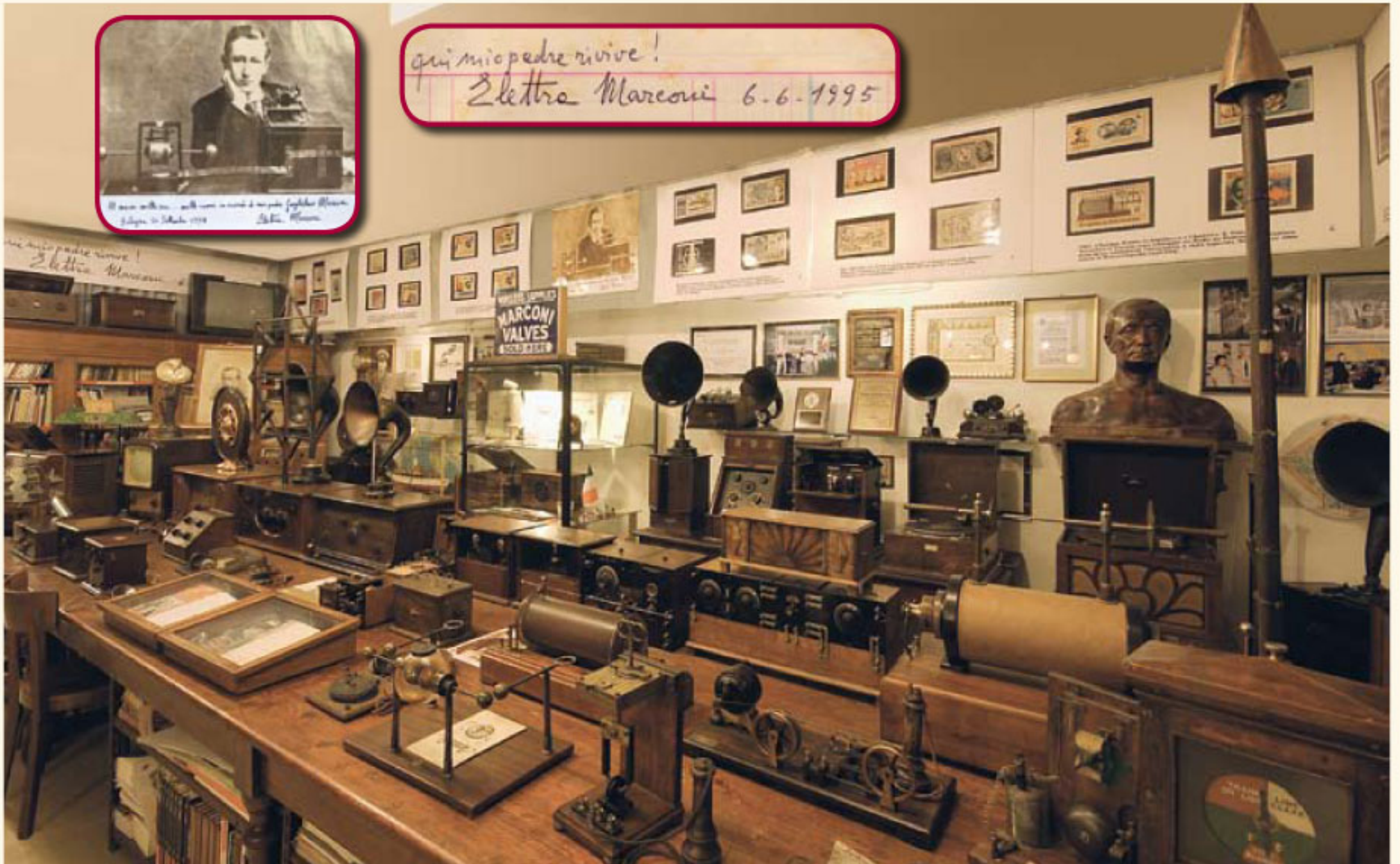
Sala Marconi (particolare)